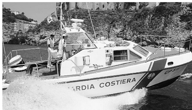
Lo Yacht Club organizza diversi corsi per la sicurezza in mare

■ A maggio tocca al 3° Trofeo velico Roberto Allodi