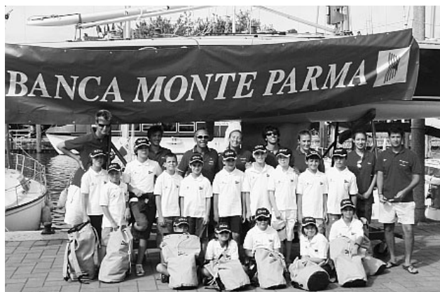
I 15 ragazzi che hanno partecipato al corso di vela a Desenzano

■ Sabato 28 è in programma un corso di un giorno di meteorologia con Gianfranco Meggiorin